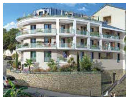
NICE VIEW / Nice