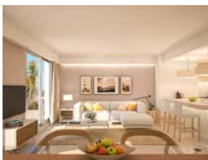
RIVIERA MELODY / Juan-les-Pins