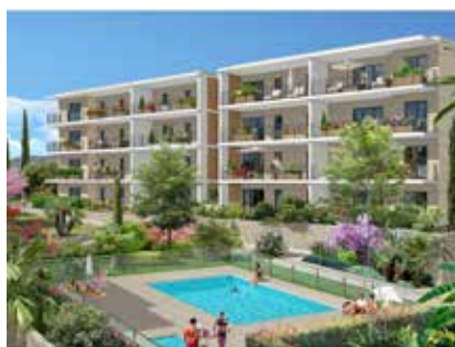
LES HAUTS DU GOLFE / Vallauris